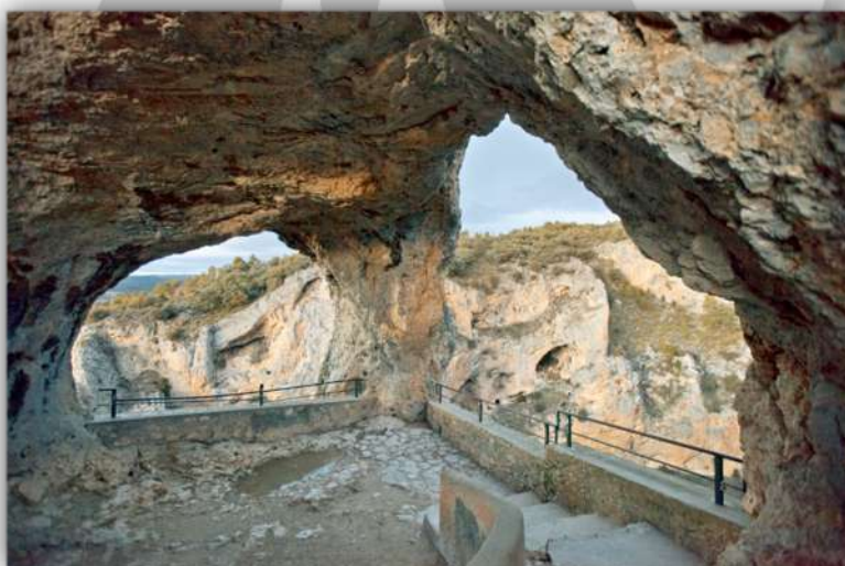
El mirador del Ventano del Diablo.

Una aventura en la Serranía de Cuenca , un lugar único donde disfrutaremos de la naturaleza , la roca y el agua .